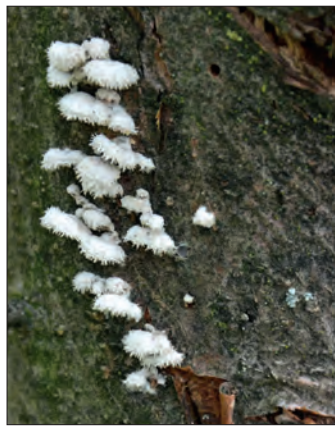
Abb. 6: sekundärer Befall des Schwarzen Rindenbrandes mit dem Spaltblättling