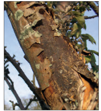
Abb. 16: Pseudomonas -Befall an Apfel