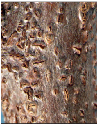
Abb. 5: Diplodia -Fruchtkörper durchbrechen die Rinde eines Birnenstamms