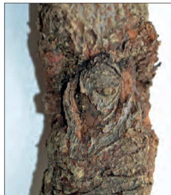
Abb. 18: Obstbaumkrebs an Apfel