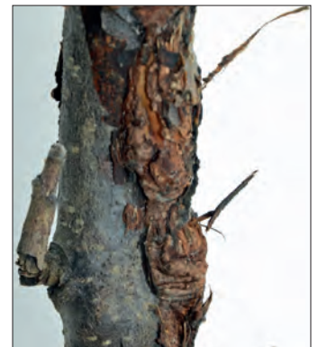
Abb. 20: Phomopsis -Befall an Apfel

ihnen als Nahrungsgrundlage. Gerade im Frühjahr, wenn der Saftstrom einsetzt, tritt an den Schnittstellen zuckerhaltiger Pflanzensaft aus, der von den Schwärzepilzen als Nahrung genutzt wird [Abb. 13]. Sie sporulieren dabei oft so stark, dass die Sporen mit Niederschlägen den Stamm bzw. Ast heruntergewaschen werden und die Rinde oberflächlich verfärben.