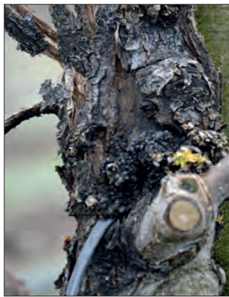
Abb. 7: Ablösende Rinde bei fortgeschrittenem Diplodia -Befall