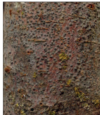
Abb. 19: Valsa-Krötenhautkrankheit an Apfel