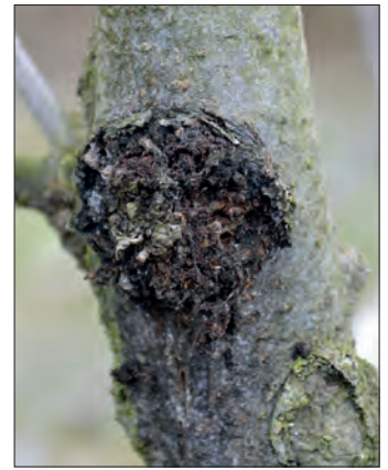
Abb. 4: schwarz verfärbtes Adventivwurzelfeld durch Diplodia -Befall