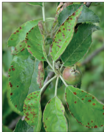
Abb. 10: Diplodia -Blattsymptome an Apfel