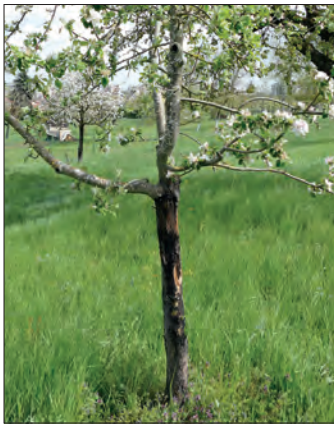
Abb. 1: Schwarzer Rindenbrand an Streuobstbaum