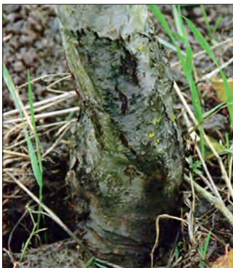
Abb. 17: Kragenfäule-Befall ( Phytophthora )