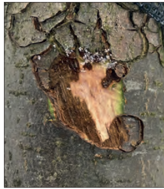
Abb. 14: Kambium eines Birnenstamms am Übergang von geschädigt zu nicht geschädigt: braune Farbe tot, weiß-grüne Farbe lebend