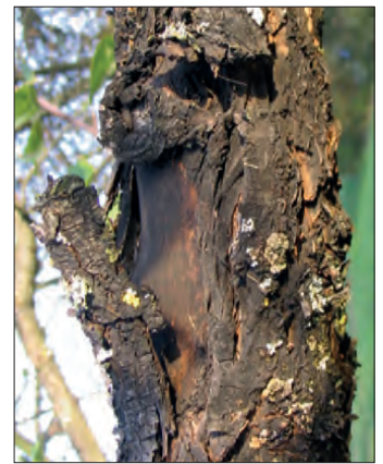
Abb. 8: ältere Diplodia -Befallsstellen wirken wie verbrannt