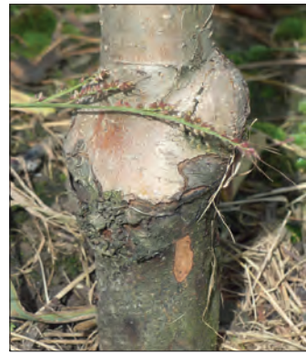
Abb. 15: Feuerbrand-Unterlagenbefall an Apfel