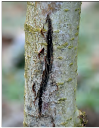
Abb. 3: beginnender Diplodia -Befall in Wachstumsrindenriss