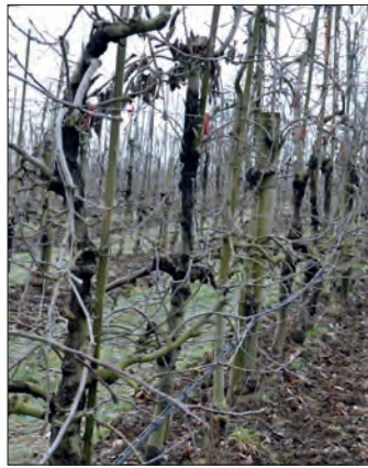
Abb. 2: starker Befall einer Apfelanlage mit Schwarzem Rindenbrand