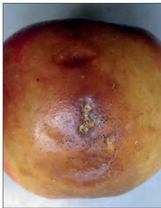
Abb. 11: Diplodia -Fruchtsymptom