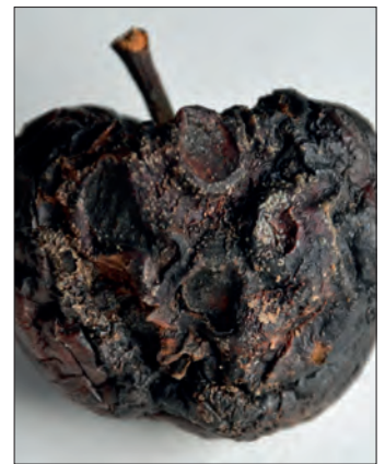
Abb. 12: Frucht mumie mit Diplodia -Befall

fäule vorliegt [Abb. 9]. Blattsymptome sind dagegen sehr selten zu beobachten [Abb. 10]. Dabei handelt es sich um braune, rundliche Flecken, die zu dem grünen Blattgewebe scharf abgegrenzt sind und mit der Zeit zusammenlaufen. Manchmal bilden sich in ihnen die schwarzen Fruchtkörper des Pilzes.