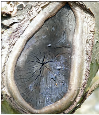
Abb. 13: Verwechslungsgefahr: harmlose Schwärzepilze an Schnittstelle